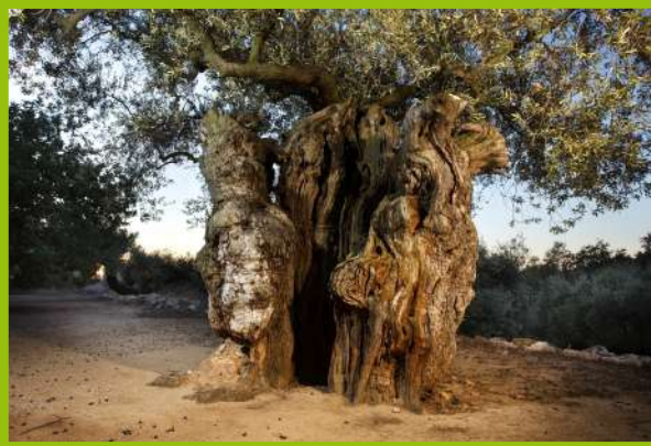
12 Àrea de Muntells G 40.504914 0.309177

Sant Jordi té 153 oliveres mil·lenàries inventariades i repartides per tot el seu terme. S'han fet 2 àrees: Mas Na Cabanes (a 5,7 km) i Els Muntells (a 1,9 km) i s'han indicat els itineraris que porten a elles.