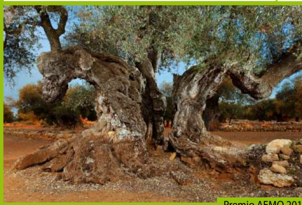
Premio AEMO 2014